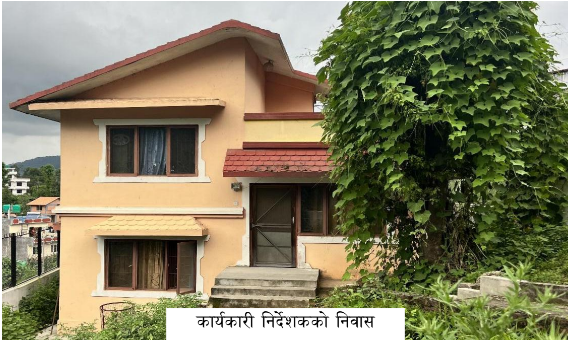
कार्यकारी निर्देशकको निवास

शिक्षा तालिम केन्द्रमा कार्यकारी निर्देशकको बसाइका लागि छुट्टै निवासको व्यवस्था रहेको छ ।